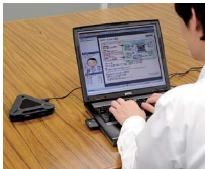
撮影時に使用したマイクスピーカーは、より小さく、よりシンプルなPJP-20UR。