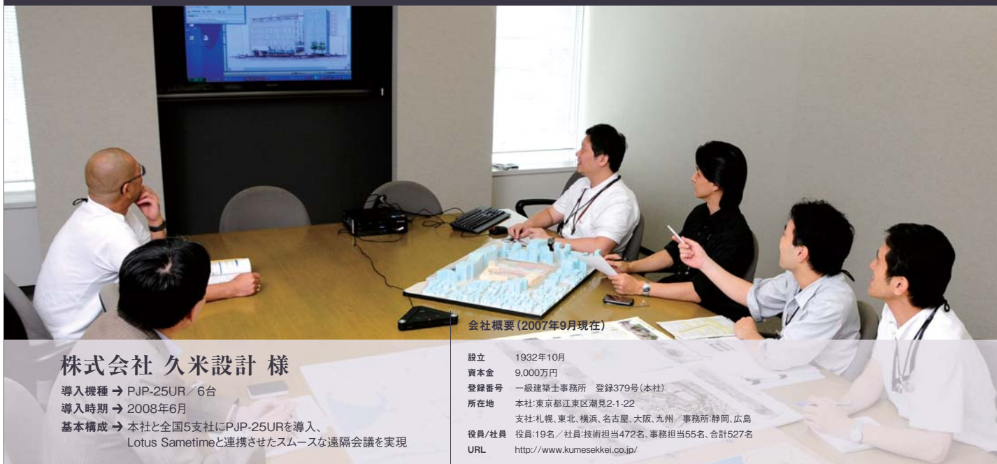
会社概要(2007年9月現在)