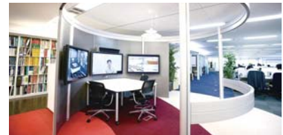
設置例(1) コクヨ様設け関オフィス内