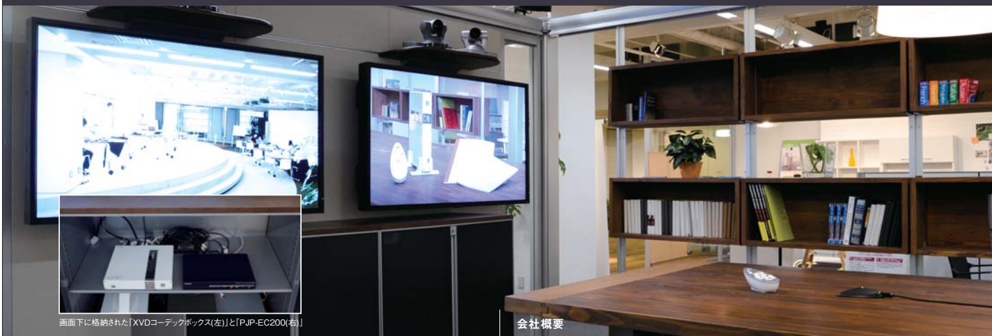
画面下に格納された「XVDコーデックボックス(左)」と「PJP-EC200(右)」