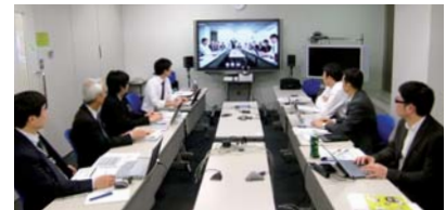
設置例(2) コクヨ様品川オフィス内会議室