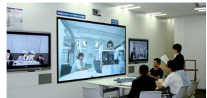
設置例(3) コクヨ様品川オフィス内作業ルーム