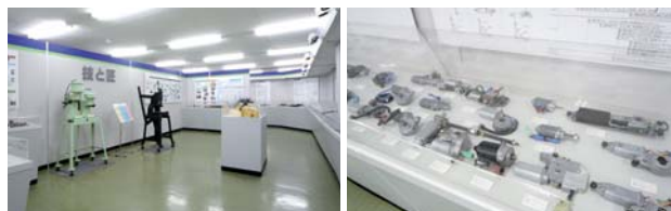
ミツバ様の製品・技術展示ルーム。安全性や快適性を追求した製品が、クルマを始めとする幅広い分野で活躍しています。

すでに100台以上のPJP-50Rを導入している同社では、ヤマハの電話帳サーバ「RTV01」を導入し、今後より高度な活用方法を検討されています。まずRTV01を使えば、個々のPJP-50Rに独自番号を付与でき、IP接続時でも電話と同じ操作でPJPが使えるようになります(使用の推進)。またRTV01に各種機材を登録することで、機材を一元管理できるとともに、IPアドレスが変動するDHCP環境でも常に同じ番号で使用ができます(ロケーションフリー)。さらに、拠点状況、通話状況、通話履歴を一括管理できるので、使用状況が可視化でき、投資対効果を即座に把握できます(使用状況の把握)。こうしたPJPの高度な活用が、同社の業務コミュニケーションをさらに円滑なものにしていくことでしょ。