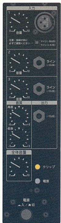
(リアパネル操作部)

軽量・コンパクトだから扱いやすい! 重さ11kg、 高さ45.6cm×幅27.5cm×奥行25.5cm。