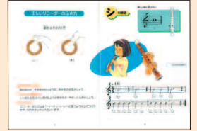
写真は児童用です

(収録曲) シの練習、たこたこあがれ、からす、ほたるこい、なべなべそこぬけ、いちばん星みつた、つきよ、こゆき、わになって、てるてるぼうず、さよなら、よろこびの歌、かっこう、せい者の行進、はと、チューリップ、トロイカ、かえるの合唱、キラキラ星、雪のおどり